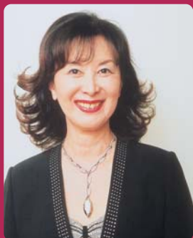
岸 恵子(きし・けいこ)

※ご来場は公共交通機関をご利用下さい。お車でお越しの方は会場地下駐車場または最寄の駐車場を(有料)ご利用下さい。